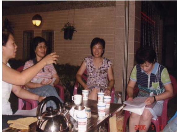
↑ 社區住戶利用每天晚上泡茶聚會時，聯繫友誼、分享心得及協調分工事宜。