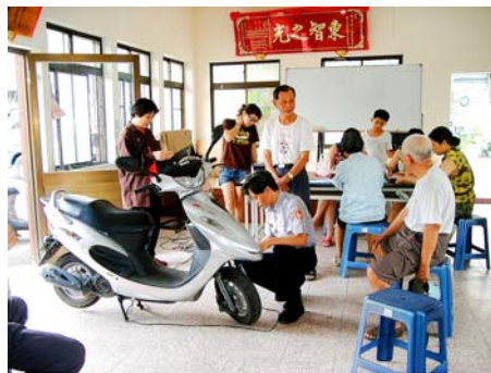
治安維護－機車烙印