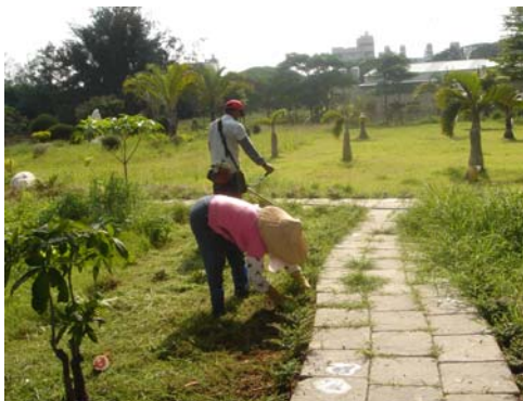
↑ 公園綠地環境維護