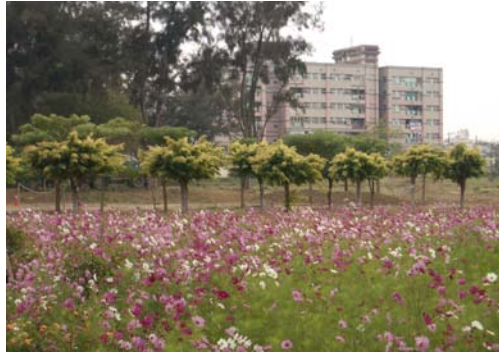
↑ 荒地變綠地—空地活化生活添趣